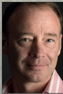
Hans-Jürgen Hufeisen Komponist, Blockflötist